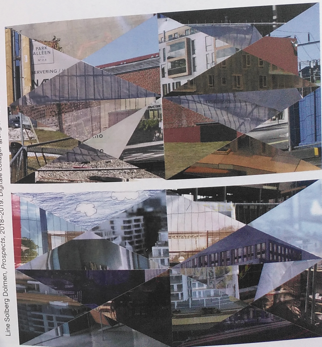
Line Solberg Dolmen, Prospects, 2018–2019. Digitale collager gjengitt med tillatelse fra kunstneren.

Tradisjonelt er det mange «menn på sokkel» ute i offentlig rom, altså bronse – eller steinstatuer av menn som har spilt en større eller mindre historisk rolle. Her i Lillestrøm er det en del god, offentlig kunst som utfordrer den tankegangen, men samtidig synes jeg det er viktig å se helt andre muligheter for utendørs kunst også, så som temporære verk, lydarbeid, og i mitt tilfelle: Noe som kanskje ser litt tilfeldig ut, som ikke er så opphøyd, som er nærrere dagliglivet og det som ellers rører seg her i byen.